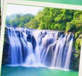
น้ำตกสีเฟิน