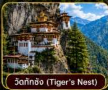
วัดทักซิง (Tiger's Nest)