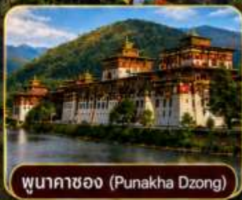
พูนาคาซอง (Punakha Dzong)