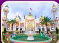
ชมบึงสีติกลางปิตาณี