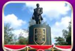
อนุสาวรีย์กรมหลวงชุมพรฯ