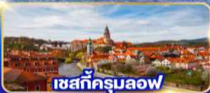
เซสท์ครุมลอฟ