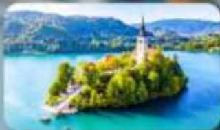
โบสถ์พระแม่มาเรียแห่งบลัด