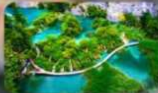
อุทยานแห่งชาติพลีทวิเซ่