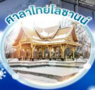
ศาลาไทยโลซานน์