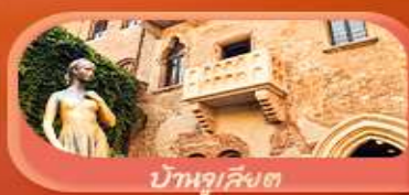
บ้านจูเลียต