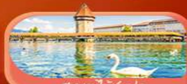
สะพานไม้ซังปก

Highlight เยือนหมู่บ้านแสนสวยเซอร์แมท เช็กอินศาลาไทยสุดงามที่โลซาน เที่ยวลูเซิร์น ชมสะพานไม้ซังและอนุสาวรีย์สิงโต ซาลี แพลทิน ชมประติมากรรม The Fork และปราสาทซิลลองริมทะเลสาบ เยือนมิลาน มหาวิหารดูโอโม เที้ยวเวนิส เมืองลอยน้ำสุดโรแมนติก อินกับรักอมตะที่บ้านจูเลียต และช้อปปิ้งจุใจที่ Serravalle Outlet