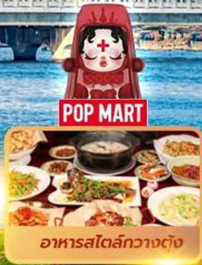
อาหารสไตล์กวางตุ้ง