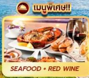
SEAFOOD + RED WINE