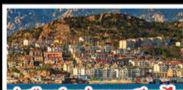
ท่าเรือชาวประมงเยียนไถ