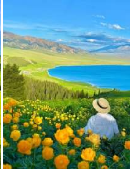
พาท่านนั่งกระเช้าชมทุ่งนาราติจากมุมสูงและรถอุทยานนำเที่ยวรอบทุ่ง