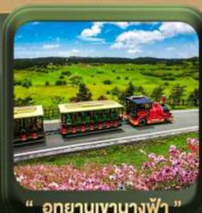
" อุทยานเขานางฟ้า "

T2G-CKG26CZ Special of Chongqing...ลงชิ่ง ต้าจู้ อุ่หลง อุทยานหลุมฟ้า เขานางฟ้า 5D 3N (CZ)