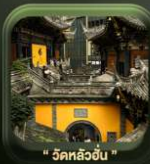
" วัดหลิวอัน "