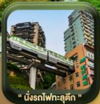
" นิ่งรถไฟทะลุคิก "

บินตรงลงดงชิ่ง • อุ่หลง หลุมฟ้าสะพานสวรรค์ • ระเบียบแก้ว • อุทยานเขานางฟ้า หงหยาดัง • นิ่งรถไฟทะลุคิก • ศาลาประชาม (ด้านนอก) • หลงหมินฮ่าว มรดกโลกผาหินแกะสลักต้าจู้ • วัดหลิวอัน • ตึกตะเกียบ • ถนนคนเดินเจียฟางเป็ย