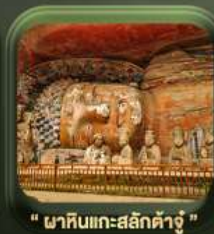
" ผาหินแกะสลักต้าจู้ "