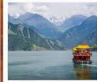
ช่องเรือทะเลสาบเทียนฉือ

เส้นทางสายไหม เริ่มต้นเพียง 53,999 FREE VISA