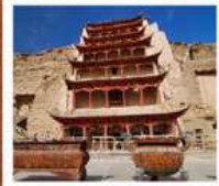
ถ้ำม่อเถาตุ