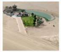
เมืองทรายหมิงซาซาน