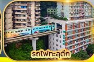
รถไฟฟ้า-สุดค