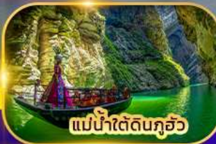
แม่น้ำใต้ดินกุ้อว