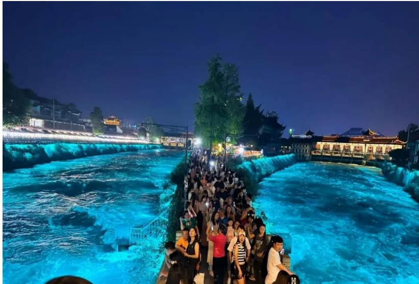
อย่างลึกลับราวกับโลกแห่งเทพนิยาย