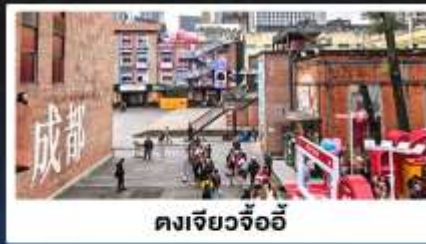
ตงเจียวจ้ออี้