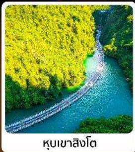
คุบเขาสิงโต

โอล์ก! ปืนตรงลงเอ็นซือ ที่ยวเอ็นซือเน้นๆจัดเต็มทั่วเมือง คุบเขาสิงโต ผิงซานแกรนด์แคนยอน อุกยานจีนลีซ่าน