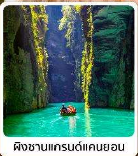
ผิงซานแกรนด์แคนยอน