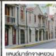
แลนด์มาร์กจางหยวน

เซี่ยงไฮ้ คคลาศสิก ไนท์ / 3 ดึกใหญ่แห่งเซี่ยงไฮ้ คองเรือหมู่บ้านโบราณจูเจียเจียว / EKA Tianwu / วัดหลงหัว แลนด์มาร์ก จางหยวน / ถนนหวยไห่ / ชมโชว์ ERA ที่โรงละครโด่งดังระดับโลก / ซินเทียนตี้