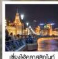
เซี่ยงไฮ้ คคลาศสิกไนท์