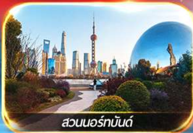
สวนนอร์มัลด์