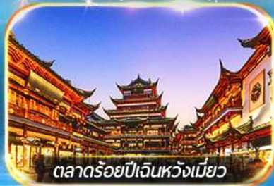
ตลาดร้อยปีเงินหวงเมียว

ถ่ายรูปชมสวนนอร์มัลด์ , เชคอินหาดไว่ทาน, วัดพระหยกขาว อิสระช้อปปิ้งถนนนานกิง POPMART FLAGSHIP STORE