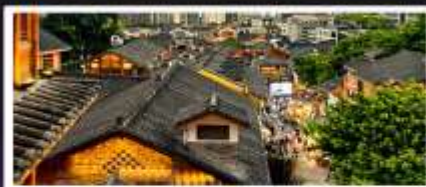
เมืองโบราณสือปาตี