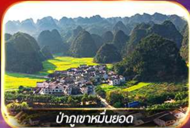
ป่าภูเขาหมื่นยอด