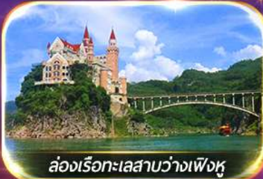
ล่องเรือทะเลสาบว่างเฟิงหู