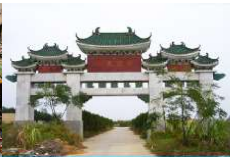
สุสานพระเจ้าตากสิน