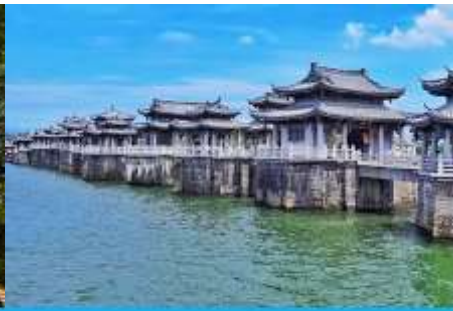
สะพานเซียงจื่อเจียว