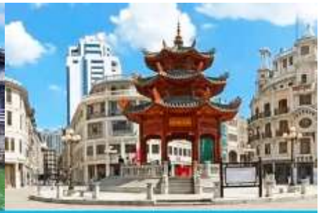
ย่านเมืองเก่าชัวเถา