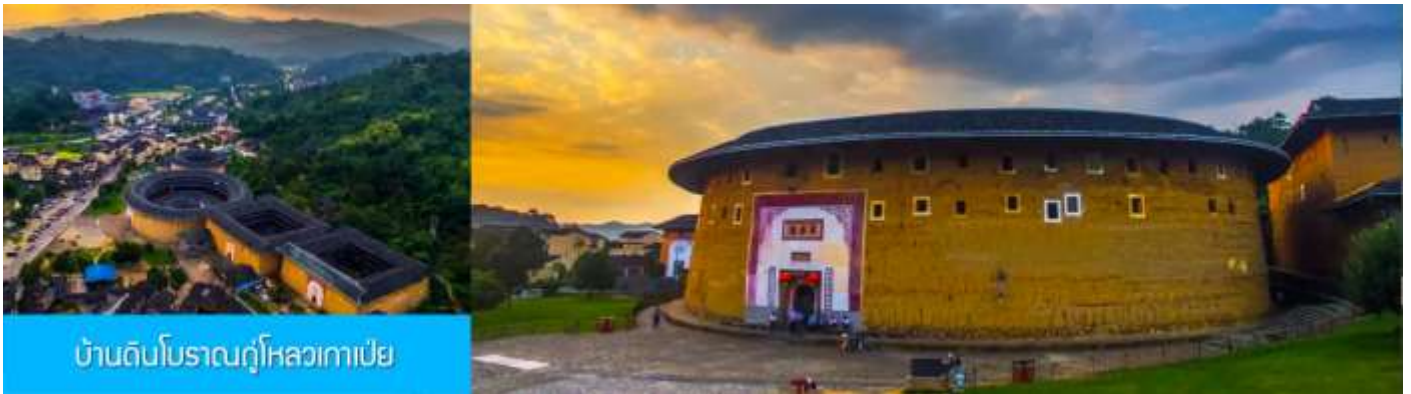
บ้านดินโบราณกุ๋โหลวกาเปย์

เจิงฉีโหลว หู่หยุนโหลว ซื่อเจ้อโหลว ฯลฯ ได้รับสมญานามว่าเป็น ราชาแห่งบ้านดิน กลุ่มบ้านดินหลายหลังนี้เป็นบ้านพักอาศัยของชาวจีนและตระกูลเจียง 江氏 นำท่านเที่ยวชม บ้านดินเจิงฉีโหลว 承启楼