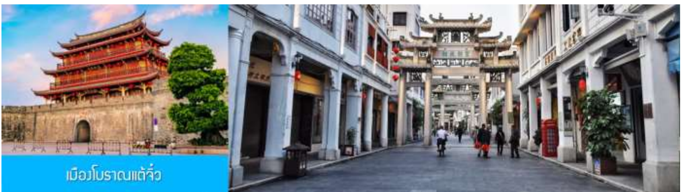
เมืองโบราณเต๋อจิว

พักที่ โรงแรม HAKKA TULOU PRINCE HOTEL 4* หรือเทียบเท่าในเมืองหย่งตั้ง