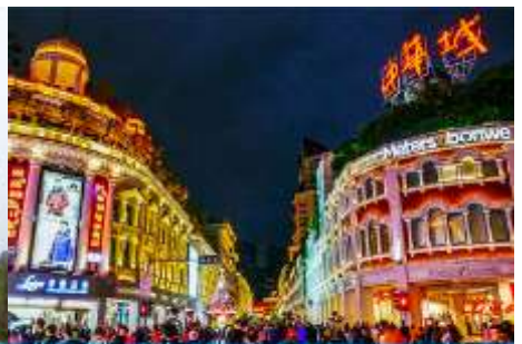
ถนนคนเดิน จวซาลู่