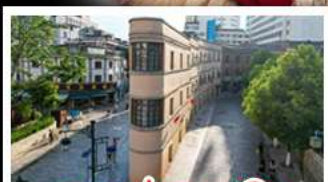
ถนนเก่าคุนหมิง