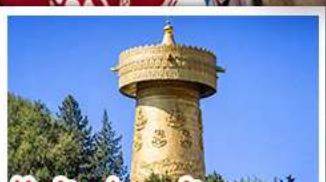
วัดต้าฝอ กงล้อมนตรา