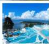
ซานโตรินี่ด้าหลี

“เกาะเสี้ยวฉู...เกาะลึกลับกลางทะเลสาบ เอ้อไห้”