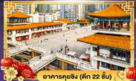
อาคารคุยซิง (ตึก 22 ชั้น)