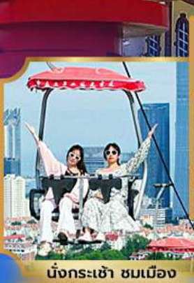
นั่งกระเช้า ชมเมือง