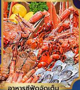
อาหารซีฟู้ดจัดเต็ม

บุฟเฟ่ต์เบียร์ไม่อื่น + ซีฟู้ด + ปิ้งย่างเกาหลี