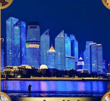
หาดโซเบอร์ฟังก์