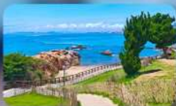
เกาะสี่เหลี่ยมเต่า