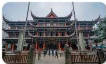
วัดเหวินซู