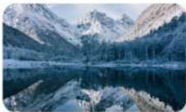
ปี้ฝิงโกว