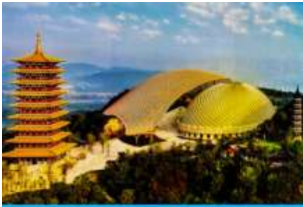
อุทยานหนิวโล่วซาน