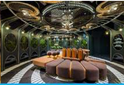
ห้องน้ำไอเทค