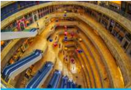
จัตุรัสเต๋อจี