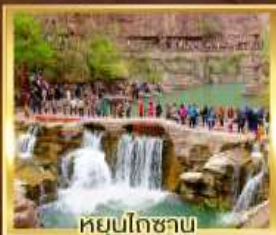
หยุ่นโกซาน