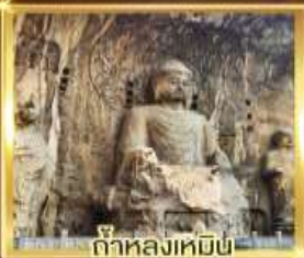
ถ้ำหลงเหมิน