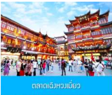
ตลาดเจิงหวงเมี่ยว