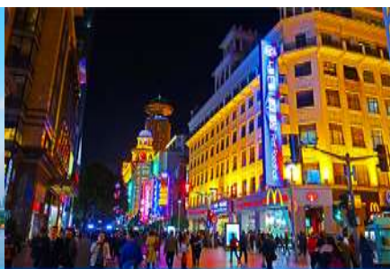
ถนนคนเดินหนานจิงลุ่