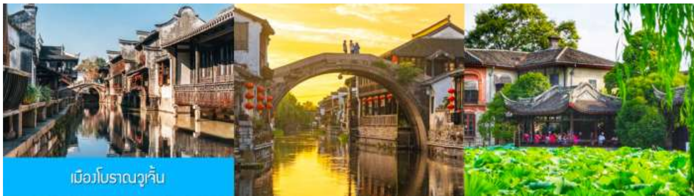
เมืองโบราณวูเจิน