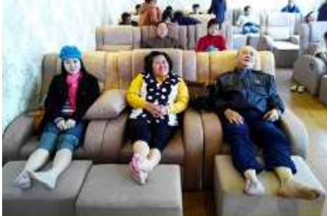
ศูนย์วิจัยแพทย์แผนจีน