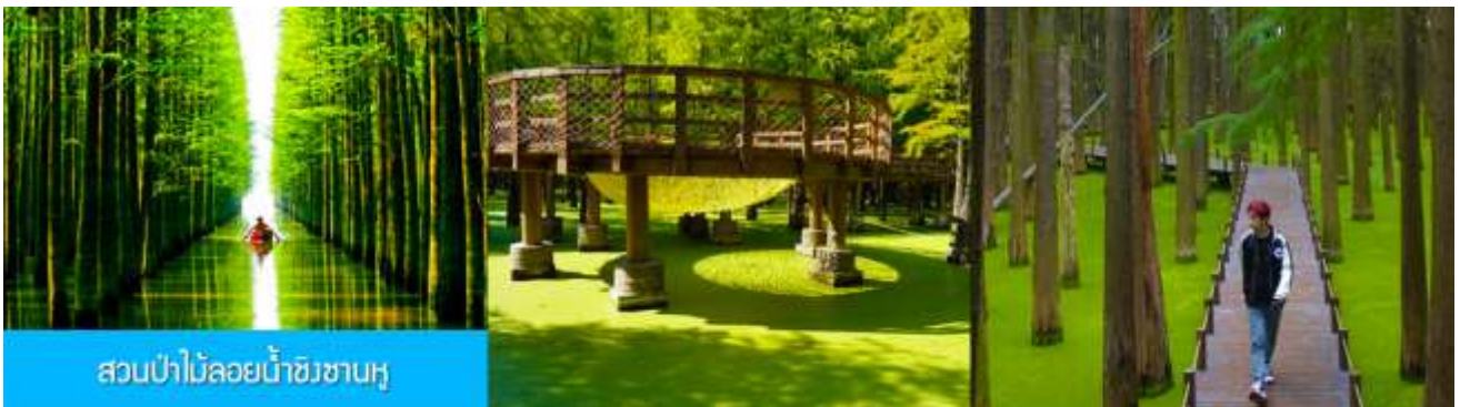
สวนป่าไม้ลอยน้ำชิงซานหู

หลังอาหารเช้าท่านเดินทางโดยรถบัสสู่เมืองหลิงอัน 临安市 (ระยะทาง 175 กม. ใช้เวลาเดินทางราว 2 ชั่วโมงเศษ)