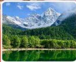
อุกยานปี้ฝิงโกว