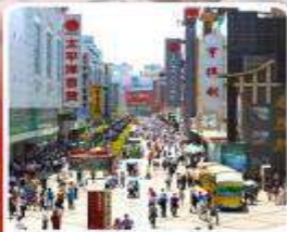
ช้อปปิ้งถนนคนเดินชุนชี่