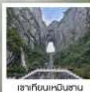
เซาเทียนเหมินซาน

ฉลองเที่ยวบินปฐมฤกษ์ เก็บครบทุกไฮไลต์!! วันที่ 10 พฤษภาคม 2569 กรุงเทพฯ - ดางซา (จางเจียเจีย)