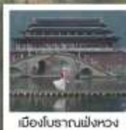
เมืองโบราณฟังหวง