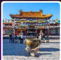
วัดต้าเจา