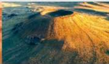
ภูเขาไฟอูลันฮาตา

*ทางบริษัทฯ ขอสงวนสิทธิ์ในการสลับโปรแกรมทัวร์ตามความเหมาะสมขึ้นอยู่กับสถานการณ์หน้างาน โดยคำนึงถึงผลประโยชน์ของลูกค้าเป็นสำคัญ