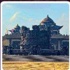
ศูนย์วัฒนธรรมหยวนหยิว