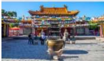
วัดต้าเจา