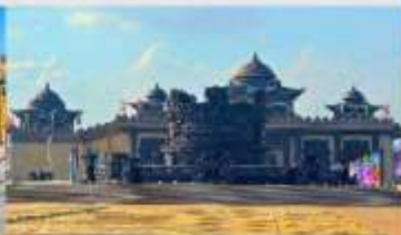
ศูนย์วัฒนธรรมหยวนเหยิว