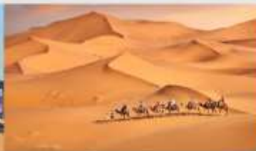
ทะเลทรายเสียงชวาว