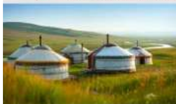
ทุ่งหน้าออร์ดอส