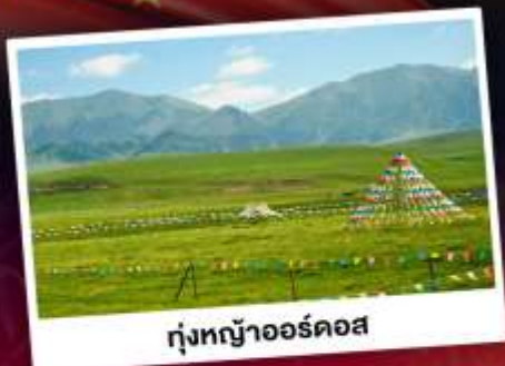
ทุ่งหญ้าออร์ดอส