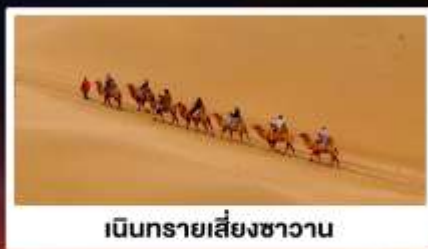
เนินทรายเลี้ยงชาวน