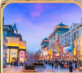
ถนนหวงฟู่จิ่ง