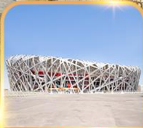
สนามกีฬาแห่งชาติ