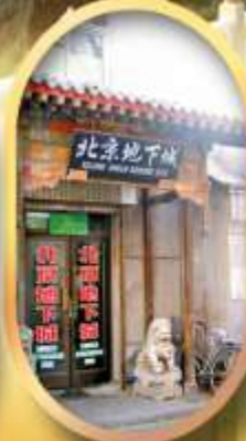
เมืองโบราณใต้ดิน