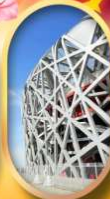
ผ่านชมสนามกีฬาโอลิมปิก