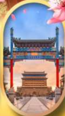
ถนนคนเดินเจียมเหมิน