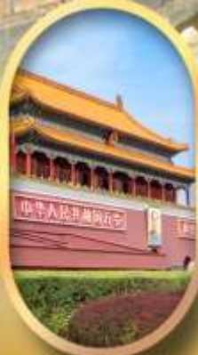
จัสมตรีสเทียนอันเหมิน