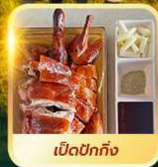
เบ็ดปักกิ้ง