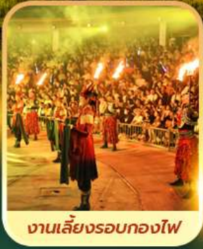
งานเลี้ยงรอบกองไฟ