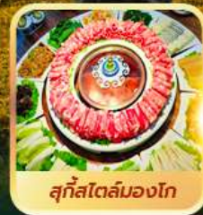
สุกีสโตล์มองโก