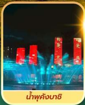
น้ำพุคังบาซี