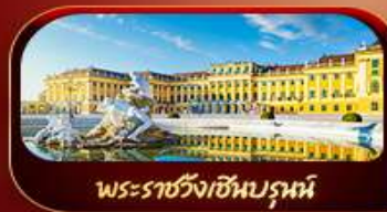
พระราชวังเซนต์มาร์ติน