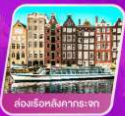
ส่องเรือหลังคากระจก