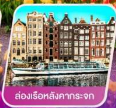
ล่องเรือหลังคากระຈก