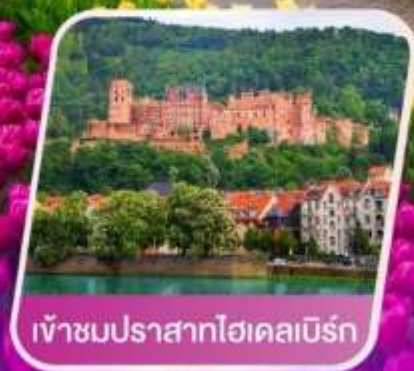
เข้าชมปราสาทไฮเคลบิรน์