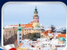
เมืองเฮสกี คุลมอฟ