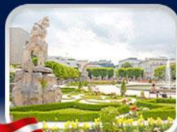
สวนมิราเบล ซาลซ์บวร์ก