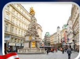
ช้อปปิ้งคาร์ทเนอร์สตรีก