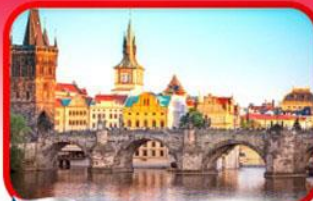
เขื่อนอินสพานชาร์ลส์