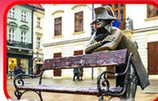
ย่านเมืองเก่าราติสลาวา

เที่ยวเมืองสวยริมทะเลสาบ ฮัลล์สตัดท์ • ชมเมืองไข่มุกแห่งโบฮีเมีย เซสกี กรุงลอน • ปราก • เวียดนาม • ซอปปิงพาร์นดอร์ฟ เอาก์เล็ท