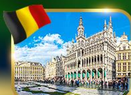
จัตุรัสกรองด์ ปลาซ บรัสเซลส์