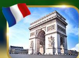
ประตูชัยฝรั่งเศส ปารีส