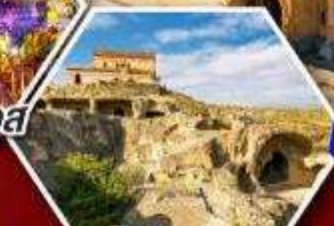
เมืองถ้ำอพลิสต์ซิคเคห์

แพ็คเกจ Rooms Hotel โรงแรมวิวทิวทัศน์ของเทือกเขาคอเคซัส