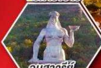
อนุสาวรีย์ มารดาแห่งจอร์เจีย