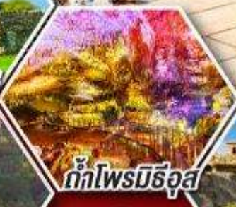
ถ้ำไฟรมิธีอุส