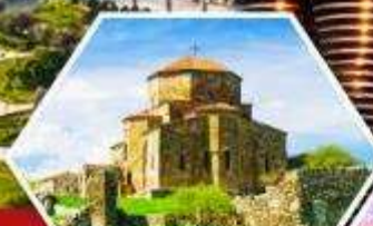
วิหารจวารี