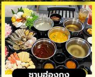
ซาบู่ฮ่องกง