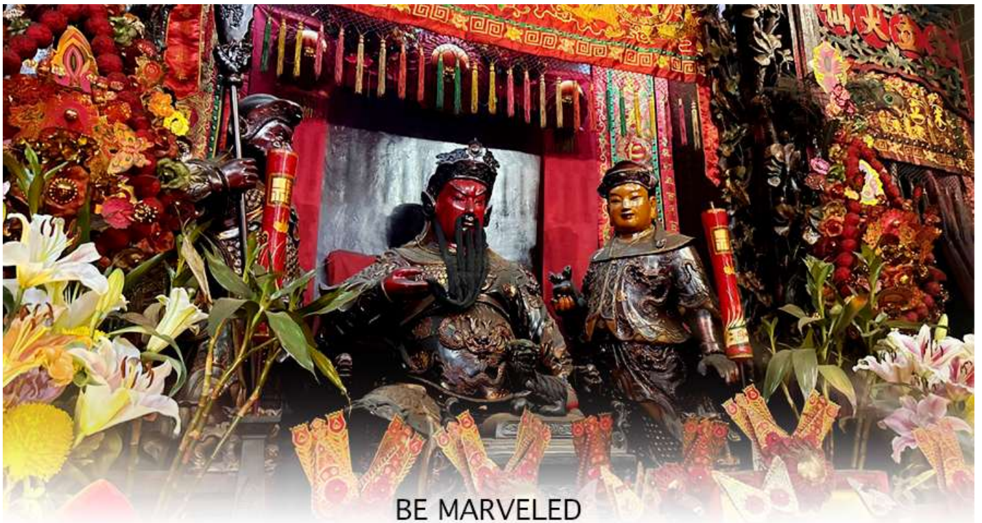
BE MARVELED วัดกวนอู

เจ้าแม่ทับทิม หรือ เทพธิดาแห่งท้องทะเล ซึ่งทำหน้าที่ปกป้องคุ้มครองชาวประมง ตั้งโดดเด่นอยู่ท่ามกลางสวนสวยที่ทอดยาวลงสู่ชายหาดให้ท่านนมัสการขอ และนำท่านเดินข้าม สะพานต่ออายุ ซึ่งเชื่อกันว่าข้ามหนึ่งครั้งจะมีอายุเพิ่มขึ้น 3 ถ้าข้ามแล้วห้ามเดินย้อนกลับไปเด็ดขาด เพราะคนฮ่องกงเชื่อว่าชีวิตจะสั้นลงไป 3 ปี สำหรับคนโสดจะนิยมขอพรกับ เทพเจ้าแห่งความรัก ให้เอามือลูบที่บริเวณหินสีดำ พร้อมกับอธิษฐานให้สมหวังกับความรัก ปิดท้ายด้วยการรับพลังฮวงจุ้ยจาก ศาลา แปรทิศ ซึ่งถือเป็นจุดรวมรับพลัง ถือเป็นจุดที่มีฮวงจุ้ยดีที่สุดในเกาะฮ่องกง และยังมีรูปปั้นองค์เทพอีกมากมายภายในวัดแห่งนี้ให้กราบไหว้ขอพร