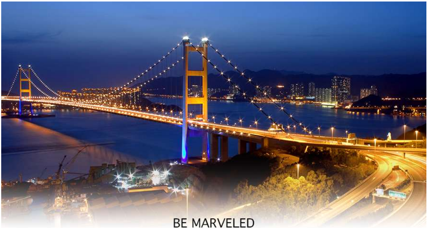
BE MARVELED สะพานแขวนฉิวหม่า