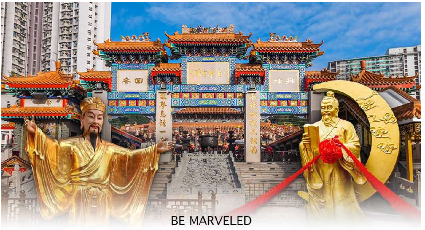
BE MARVELED วัดหวังต้าเซียน

จะพบรูปปั้นเจ้าบ่าว อยู่ทางขวา และรูปปั้นเจ้าสาวอยู่ทางซ้าย โดยมีด้ายแดงผูกโยงจากเจ้าบ่าวและเจ้าสาวมาที่เทพหยุกโหลว ซึ่งท่านจะคอยทำหน้าที่จกราชชื่อคู่รัก เชื่อกันว่าสมมุติที่ผู้เฒ่าถือในมือ คือบัญชีรายชื่อคู่รักที่จะได้รับคำอวยพรให้อยู่คู่กันอย่างร่มเย็นเป็นสุข ซึ่งจะปรากฏตัวยามค่ำคืนภายใต้แสงจันทร์ เป็นเทพเจ้าผู้เป็นอมตะที่อาศัยอยู่บนดวงจันทร์ และลงมาโลกมนุษย์ เพื่อผูกด้ายดวงชะตา ระหว่างคู่รักซึ่งเมื่อคู่กันแล้วก็จะไม่แคล้วคลาดกัน และมีความรักที่มั่นคงและยืนยาว