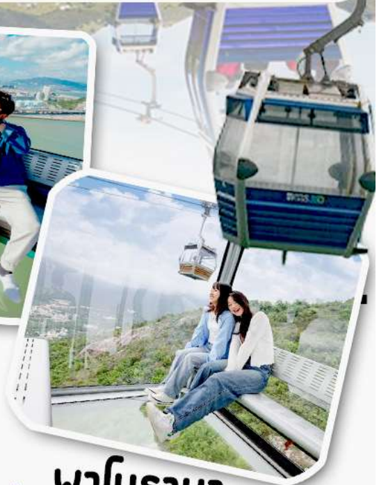
พานิราม่า