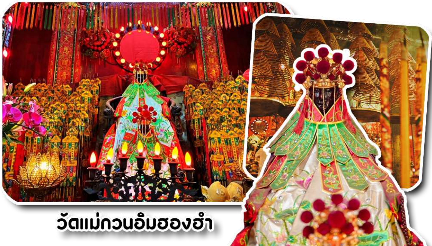
วัดแม่กวนอิมฮ่องฮ่า

เป็นวัดขนาดเล็กที่มีชาวฮ่องกงศรัทธานับถือกันเป็นอย่างมากวัดแห่งนี้เป็นที่ประดิษฐาน องค์เจ้าแม่กวนอิมฮ่องฮ่า ฮ่า ที่มีชื่อเสียงเรื่องการให้กู้ยืมเงินเชื่อกันว่าท่านช่วยพลิกฟื้นเศรษฐกิจของชาวฮ่องกง ผู้คนจึงนิยมมาขอยืมเงินทำธุรกิจจน