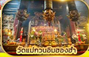
วัดแม่กวนอิมซองอ่า