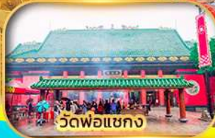
วัดพ่อแชกง