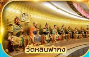
วัดหลินฟากง