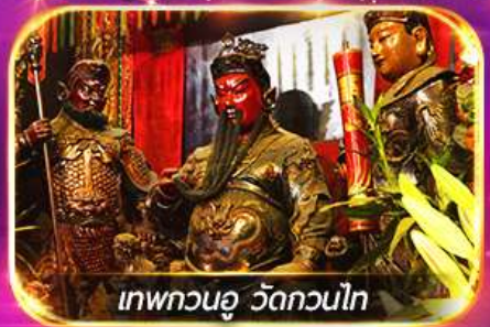
เทพทวนอู วัดกวนไท

พามูไหว้พระขอพร 8 วัดดัง เล่นเครื่องเล่นดิสนีย์แลนด์เต็มวัน ชมพลุสุดอลังการ