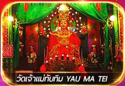
วัดเจ้าแม่ทับทิม YAU MA TEI