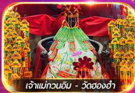
เจ้าแม่ทวนอิม - วัดฮ่องกง