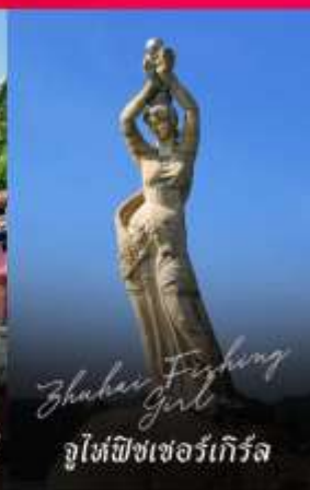
Zhuhai Fighting Girl จูไห่พิชเชอร์เทียร์รา