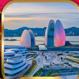
Zhuhai Opera House