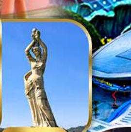
จูไห่ฟิชเชอร์รี่