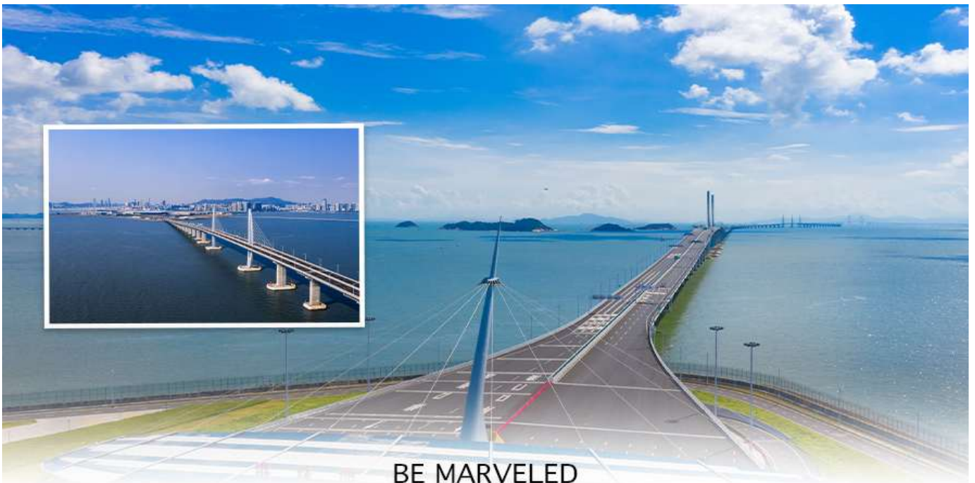
BE MARVELED สะพานข้ามทะเล ฮ่องกง มาเก๊า จูไห่ HZMB

07.00 น. เดินทางถึง สนามบินเซ็กแล็บก๊อก (CHEK LAP KOK INTERNATIONAL AIRPORT) เขตปกครองพิเศษฮ่องกง หลังผ่านพิธีการตรวจคนเข้าเมืองเป็นที่เรียบร้อยแล้ว รับกระเป๋าสัมภาระ เดินทางโดยรถโค้ชปรับอากาศ (เวลาที่ท้องถิ่นที่ฮ่องกง เร็วกว่าประเทศไทย 1 ชั่วโมง)