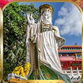
เจ้าแม่กวนอิม พลัสเบย์