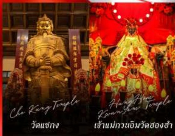
Che Kung Temple วัดแชกง

รายการทัวร์ข้างต้นอาจมีการปรับเปลี่ยนเพื่อความเหมาะสม