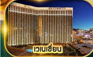
เวเนเซียน